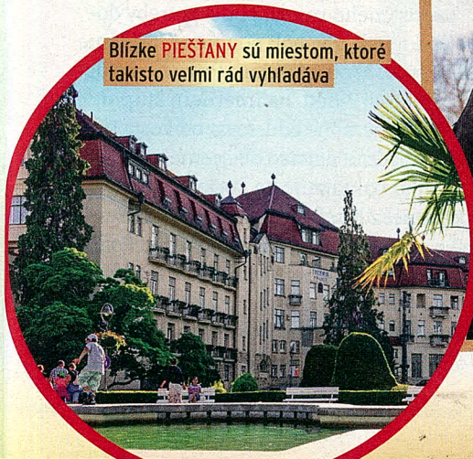
Blízke PIEŠŤANY sú miestom, ktoré takisto veľmi rád vyhľadáva