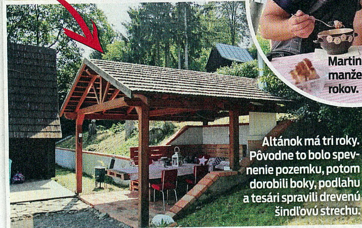
Altánok má tri roky. Pôvodne to bolo spevnenie pozemku, potom dorobili boky, podlahu a tesári spravili drevenú šindľovú strechu.